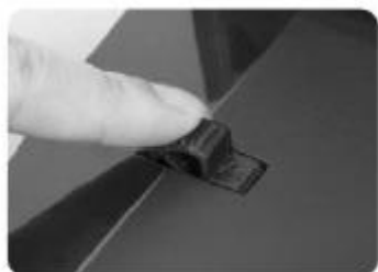
(Rys. 1) Przygotowanie do dziurkowania: Obróć kółko wyboru rozmiaru papieru (A4/A5) .

Uwaga: Proszę nie wkładać oprawy kołową, dopóki nie skończysz dziurkowania wszystkich papierów i okładek żdanego dokumentu.