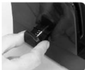
(Rys. 2) Przygotowanie do dziurkowania: Ustaw głębokość krawędzi dziurkowania pomiędzy 2 - 5 mm poprzez jej wyciągnięcie.