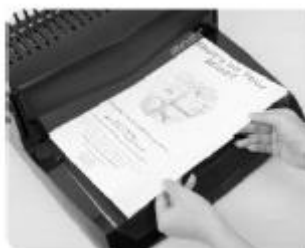
(Rys. 3) Wepchnij papier (maks. 15 arkuszy papieru 80g) do wlotu na papier .